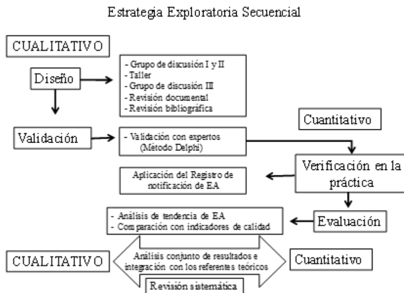
Fig. 1 - Algoritmo metodológico para el diseño del Registro de notificación de eventos adversos para unidades de cuidados intensivos polivalentes en el Hospital Provincial Dr. Gustavo Aldereguía Lima de Cienfuegos.

Para una mejor comprensión del diseño de estudio se elaboró un algoritmo metodológico organizado en dos fases (cuali-cuanti). Cada una comprendió la aplicación de diferentes técnicas de investigación (Fig. 1).