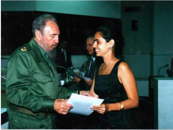
Fotografía 4. Entrega del diploma de abnegado combatiente internacionalista por la salud de los pueblos.

7* Sociedad Cubana de Medicina Intensiva y Emergencias. Capítulo de Santiago de Cuba.