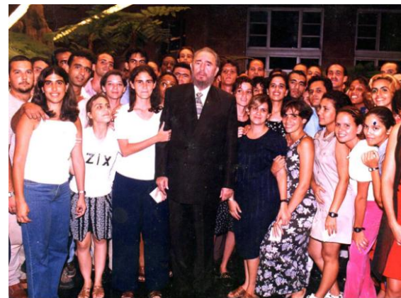
Fotografía 3. Consejo de Estado, en el 75 cumpleaños de Fidel.

Fidel, como "hombre de pueblo", se reunía con los médicos cubanos, incluso en fechas memorables. La fotografía 3 muestra un grupo de profesionales de la salud en Cuba del primer contingente de médicos de excepcional rendimiento (los cuales partieron para Haití unos meses después). La fotografía 4, de manera solemne y a cada uno de los profesionales, Fidel entregó un diploma por la misión desarrollada en Haití.