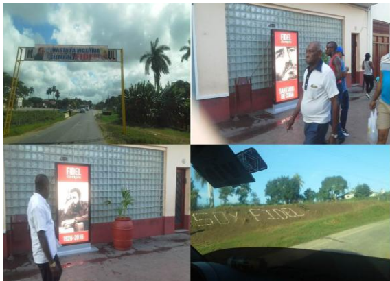
Fotografía 5. Paso de la caravana por diferentes lugares del país.

Hacemos público imágenes del paso, por la Carretera Central de Cuba, de las cenizas del Comandante Fidel Castro.