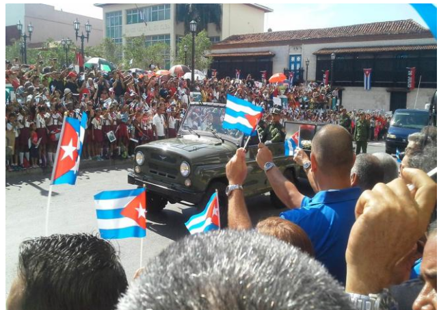
Fotografía 6. Ayuntamiento de Santiago de Cuba.