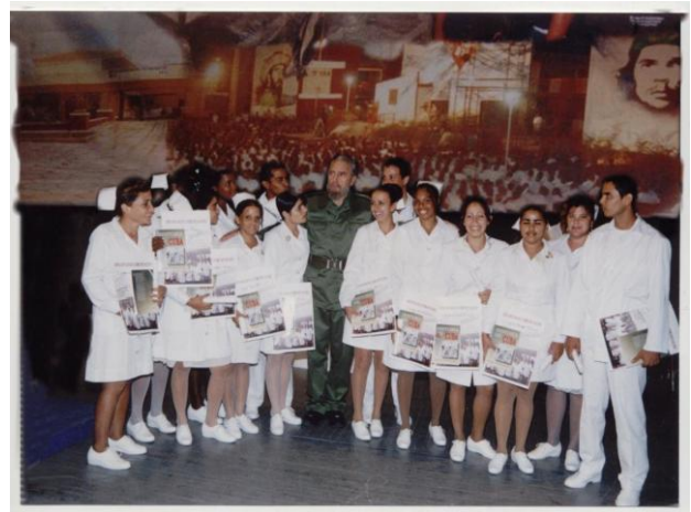
Fotografía 1. Graduación de enfermería. Villa Clara, año 1999.

2* Sociedad Cubana de Enfermería. Capítulo de Villa Clara.